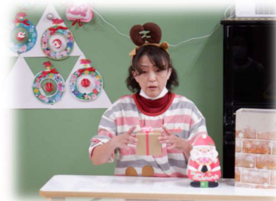
箱の中からプレゼントが...