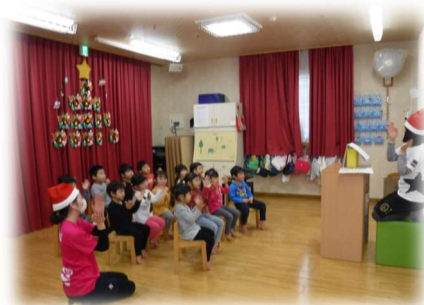
はじまり はじまり～