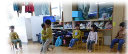
クリスマスバスケット...